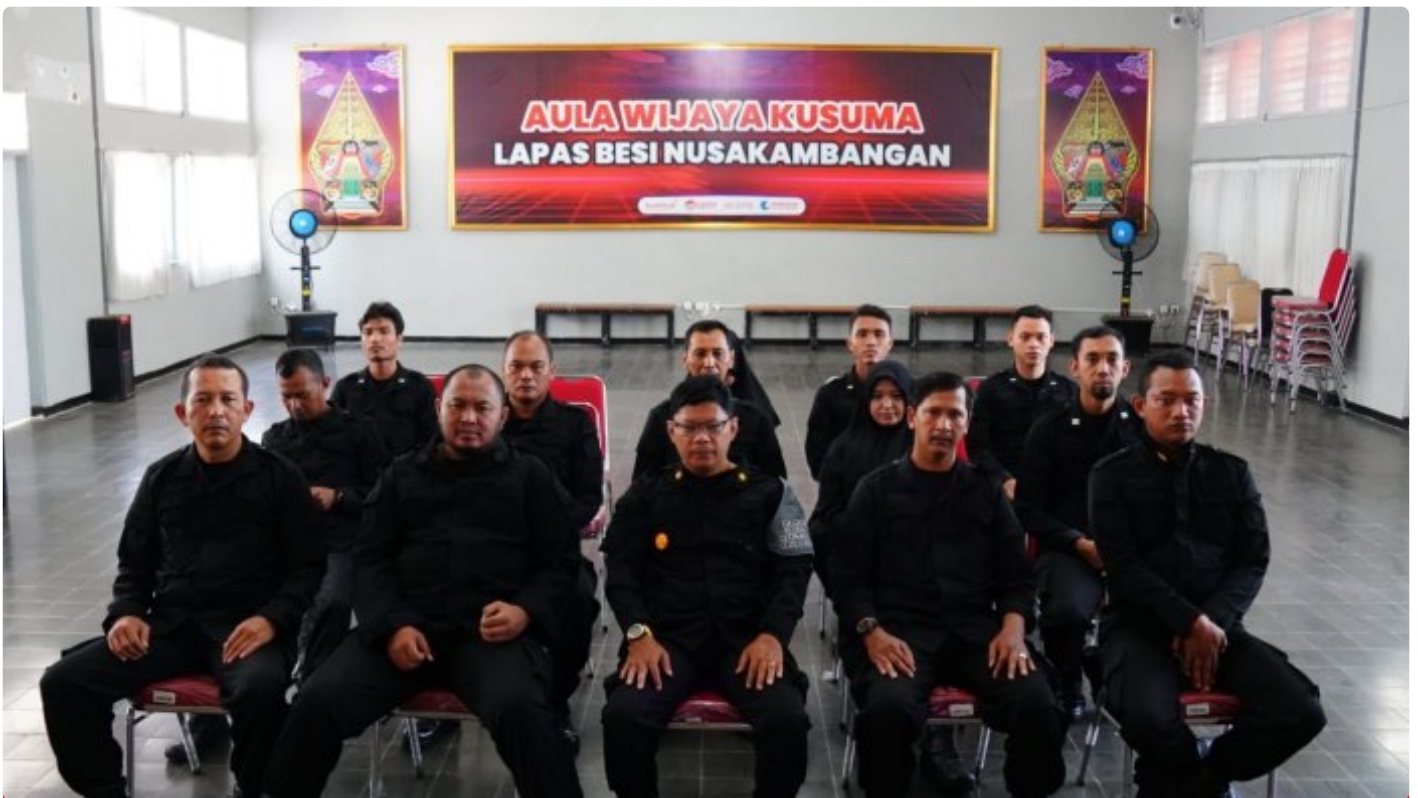
Lapas Besi Ikuti Sosialisasi Konversi Penilaian Kinerja Jabatan Fungsional

CILACAP – Lembaga Pemasyarakatan Kelas IIA Besi Nusakambangan mengikuti kegiatan Sosialisasi Konversi Penilaian Kinerja Pegawai Menjadi Angka Kredit dalam Jabatan Fungsional, (01/02/2024).